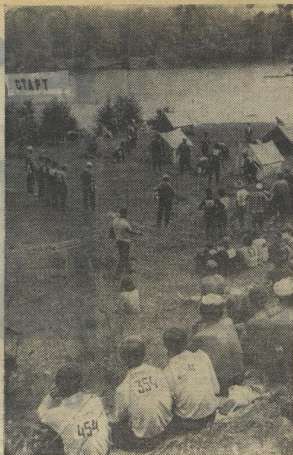
Чтобы стать настоящим туристом, надо стремиться познать землю...