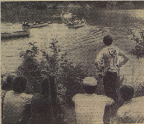
...и на воде.

Латвийская ССР, Дугупийский район, Калупинская 8-летняя школа.